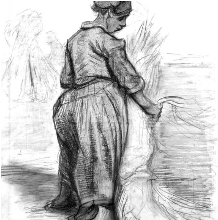
Schovenbindende boerin, juli-augustus 1885 Vincent van Gogh (1853 - 1890) Kröller-Müller Museum

In één van de lezingen gaat het over een schoof. Vandaar deze tekening...