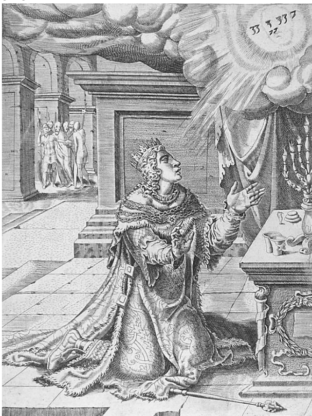
Salomo bidt tot God om wijsheid - Maarten van Heemskerck (1554) Museum Boijmans van Beuningen

Het oecumenisch leesrooster van de Eerste Dag geeft voor de 3e t/m 7e zondag na Epifanie een alternatief voor de oudtestamentische lezingen. Het zijn lezingen uit het boek 1 Koningen, te beginnen met verhalen over koning Salomo.